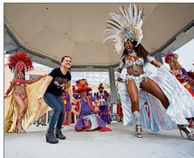
Feest in de muziekent.