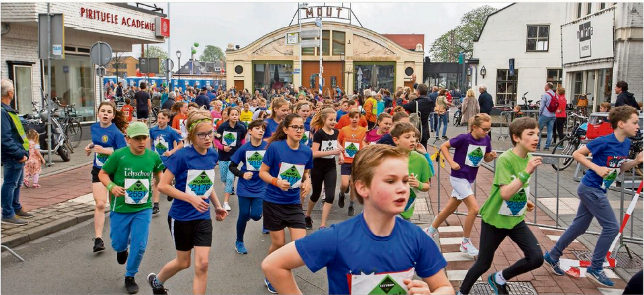
Ruim 1.600 deelnemers telde de Bink Kids Run. Dat is een record.