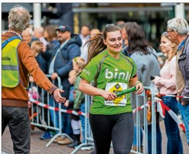
Het onderdeel estafette was nieuw.