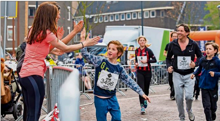
Met een high five richting de finish.