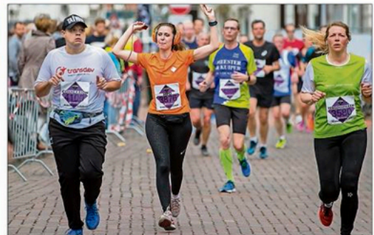
Genieten van de eigen muziek tijdens de loop.